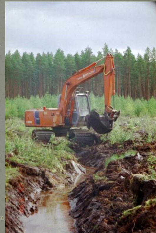
Havaintometsän ojitusta vuonna 1998

Ravintetasapainon ja kasvuedellytysten ylläpitämiseksi suometsiä joudutaan lannoittamaan. Paksuturpeisilla alueilla lisätään maaperään hivenaineita ja ohutturpeisilla typpä. Monipuolisin hivenainelannoitus voidaan tehdä metsätuhkalla. Typpilannoitus voidaan tehdä keinolannoitteilla.