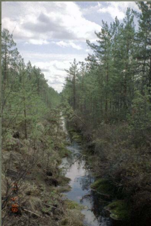
Sammaloitunut metsäojavuonna 1998