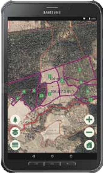
Metsäselain Android tablet

Metsäselain on mobiili metsäsuunnitelma, jonka voit ladata älypuhelimeesi.