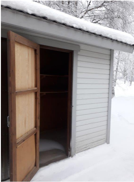
Ulkovarasto noin 14 m2