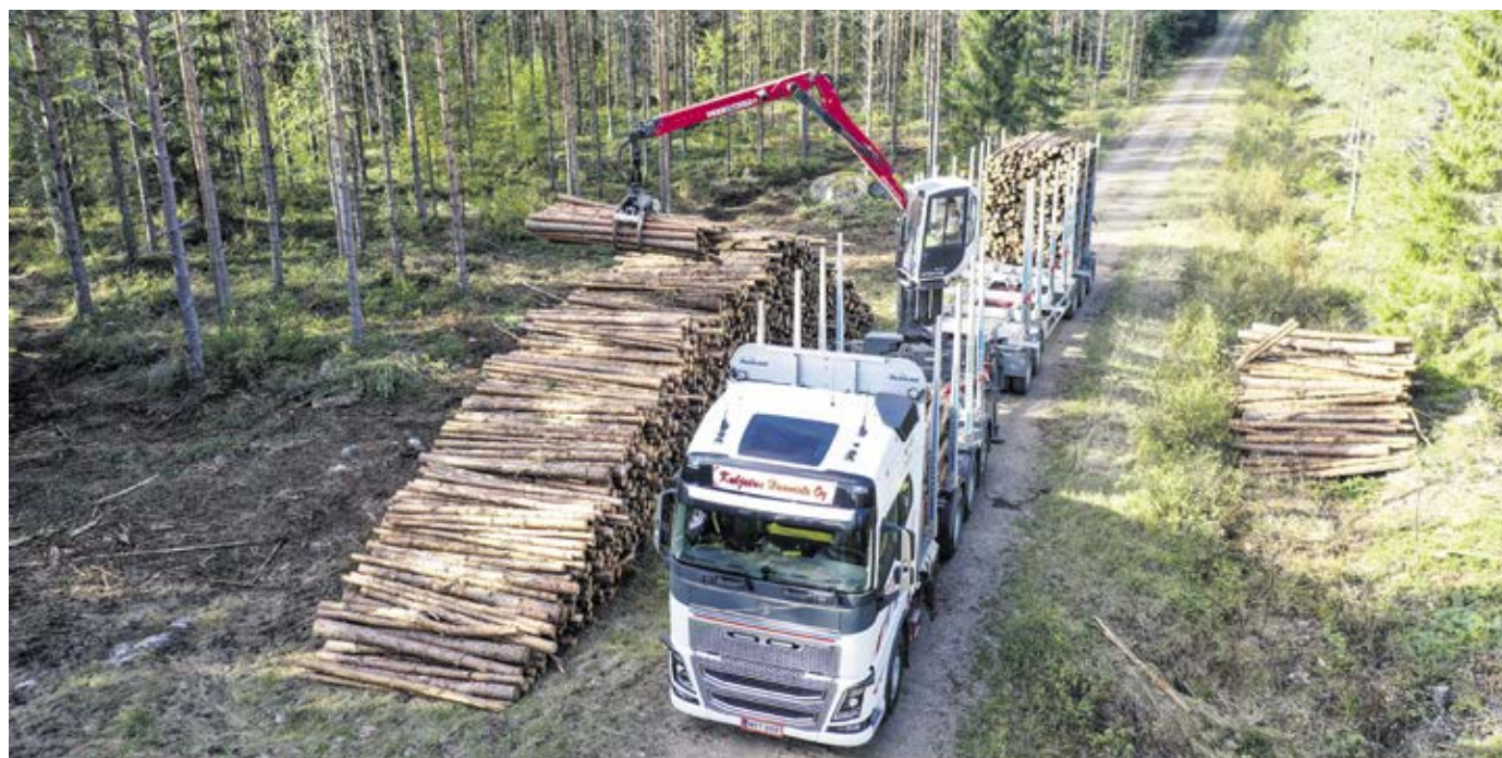
Arbetet i skogen kräver omsorgsfullhet, så att man inte skadar utrustningen eller skogen, vet Tapio Haavisto.

Än så länge råder det ingen brist på förare, men Tapio är något orolig över att transport inom skogsindustrin inte längre tycks locka nya förare. Transport av virke och skogsarbete är en teknikgren, och att enbart kunna framför en fordonskombination räcker inte.