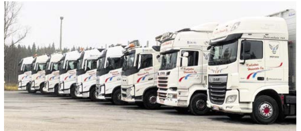
Kuljetus Haavisto har 14 egna fordonskombinationer samt en egen 1000 m 2 stor servicehall.