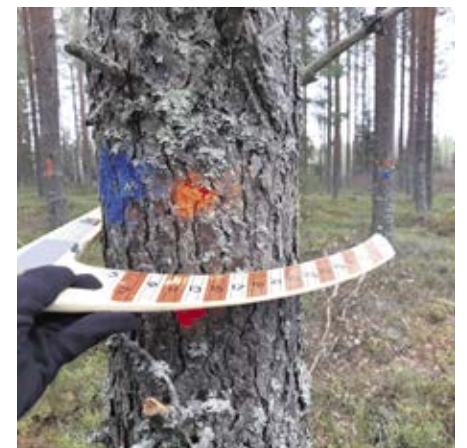
Gödslingsyta nr 1. Grundytan 30 m 2 , de grövre stammarnas diameter kring 25 cm. Beståndet kommer att gallras i vinter.

Tag kontakt med din skogsvårdsinstruktör och diskutera mera