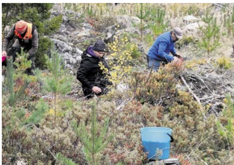
Mellanteamet höll friluftseftermiddag i Vöråskogarna och passade på att plocka lingon.