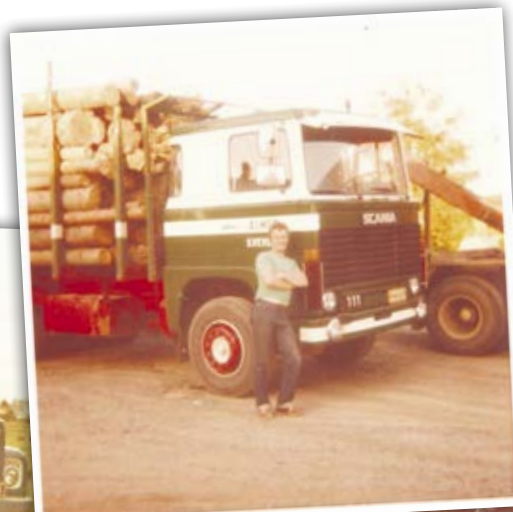
Lossning av granmassaved vid Metsäbotnia i Kaskö i slutet av 1970-talet.