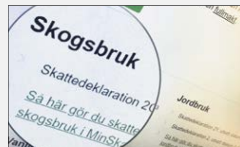
Dags att deklarerera