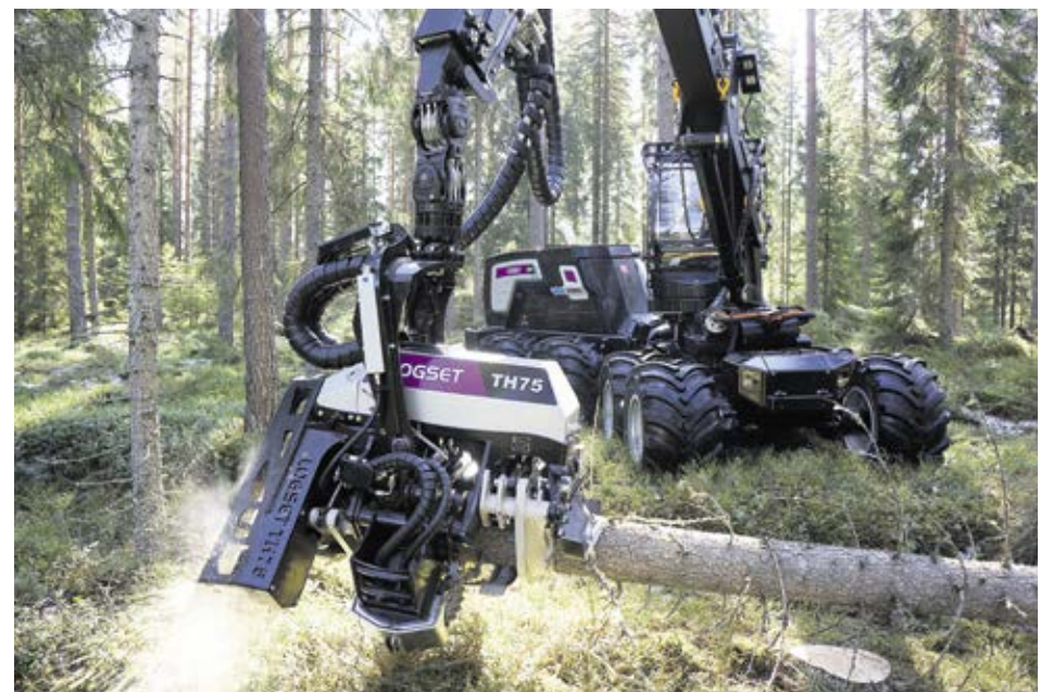
Logsetskördaren 8H GTE Hybrid skördare med ett TH75 aggregat.