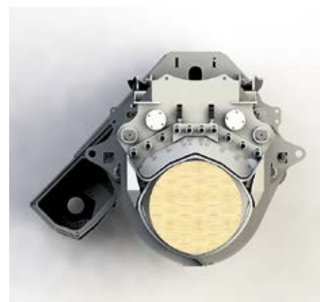
En stam i tvärsnitt i aggregatet. Längst fram mot betraktaren finns kvistknivarna där diametermätningen sker.

Man har också alltid en nyproducerad maskin i testbruk. Med den hugger man i verkliga förhållanden. Senare säljs maskinen vidare.