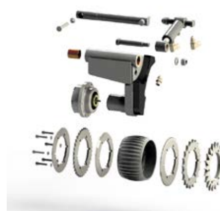
Komponenter i mät hjulet som mäter stammens längd.