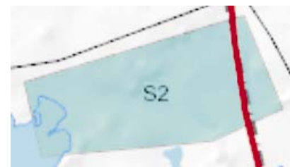
2. Mycket schematiskt skyddsområde för fiskens lekplats.

I all planering av verksamhet i naturen strävar vi till att följa naturliga gränser. Men så icke vid planering av skyddsområden. På bild 1 finns ett skyddsområde för fiskens lekplats. Skyddsområdet består av 5 raka linjer! En linje delar en gallringsfigur så att endast en smal remsa lämna mellan skyddsområdet och vägen. För att få ett tillstånd att gå in på skyddsområdet krävs ett miljötillstånd som kostar närmare tusen euro! Borde inte ett dylikt skydd följa naturliga gränser exempelvis höjdhöjkurvor?