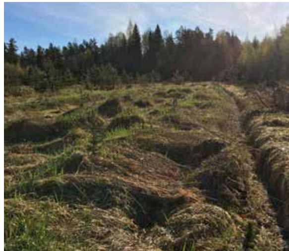
Peltoheitoissa on potentiaalia.

Joskus kuulee, ettei metsänhoidossa ihan sitä lopullista totuutta olekaan. Tässä tullaan ikuisuuskysymykseen. Kaikesta parasta olisi säilyttää aktiivinen ote koko aiheeseen. Kysellä paljon, seuloa tietoa ja toimia mieluummin etupainotteisesti kuin jälkijunnassa.