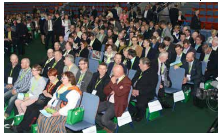
Vuoden 2017 liittokokous oli samalla MTK:n satavuotisjuhla kokous. Se järjestettiin Helsingin Messukeskuksessa.