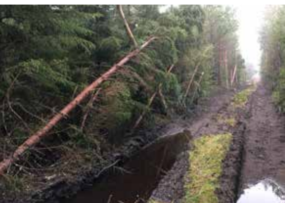
Ja tässä ainakin hyvin huonosti.

Tiedonsaanti on siitä kummallista, että vaikka pyrkisit saamaan luotettavaa tietoa, niin se voi ollakin jo valmiiksi väritynyttä.